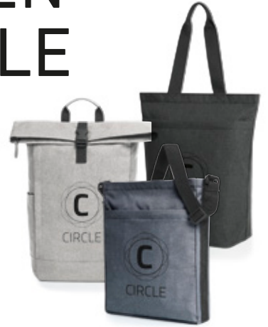
Taschenserie aus rPET

Es gibt (fast) nichts, was wir in punkto Tasche nicht gemacht hätten – und wir bleiben dran und setzen auf immer neue, nachhaltige Ideen und Materialien.